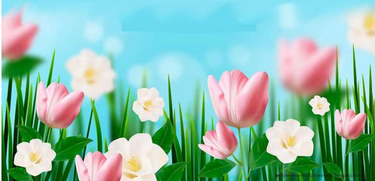
ГРАФИК ВЫПЛАТ пенсий и пособий Отделением СФР по Курской области В МАРТЕ